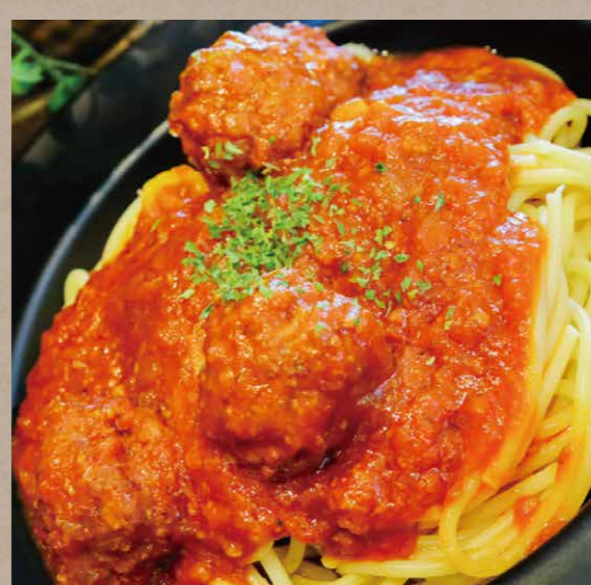
ミートボールのボロネーゼソースパスタ ¥880(税込¥880)