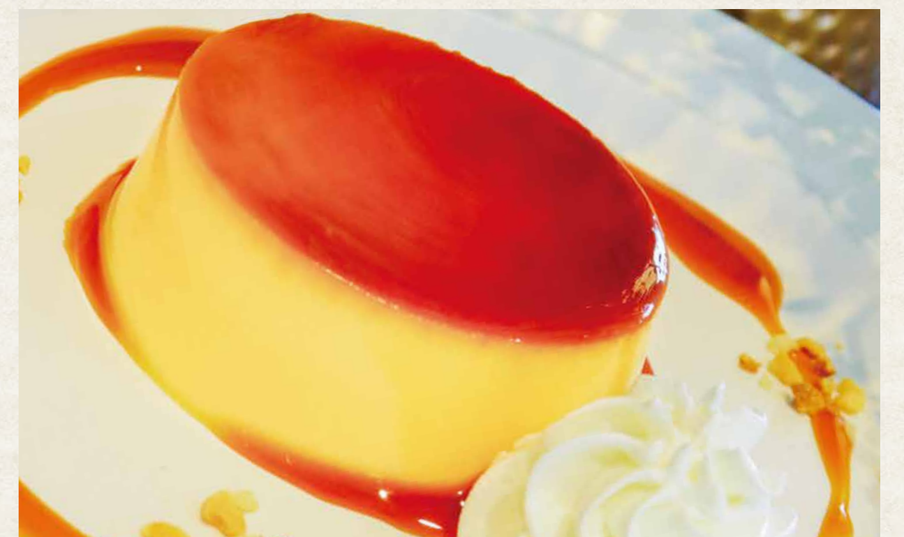
昔ながらの濃厚プリン ¥540(税込¥594)