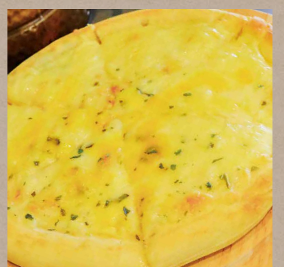
5種のチーズピッツアナポリ風 ¥730(税込¥803)