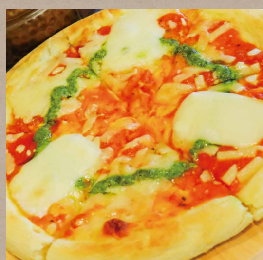
バジル香るマルゲリータピッツアナポリ風 ¥730(税込¥803)