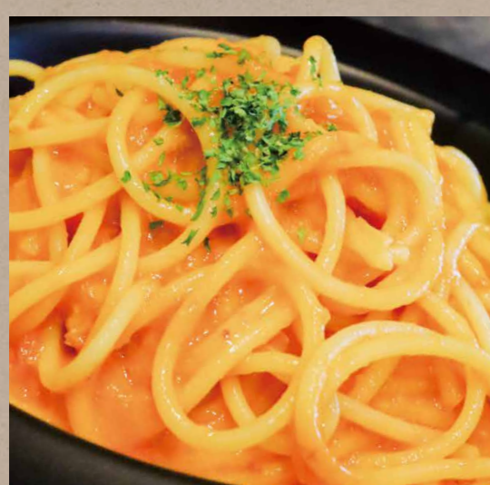
国産紅ずわいカニの濃厚アメリカーナソースパスタ ¥800(税込¥880)