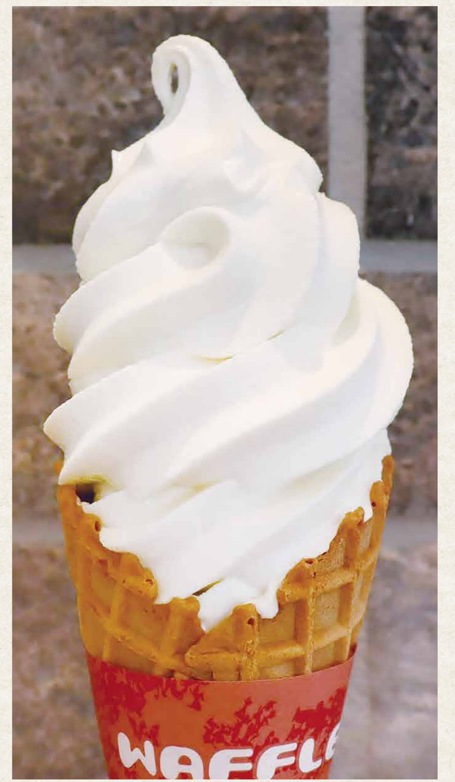
ソフトクリーム 北海道バニラ ¥280(税込¥308)