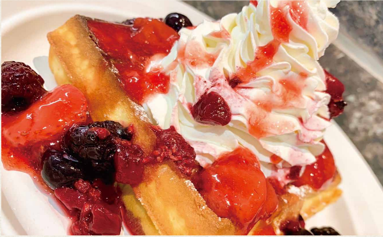
ミックスベリーのブリュッセルワッフル ¥630(税込¥693)