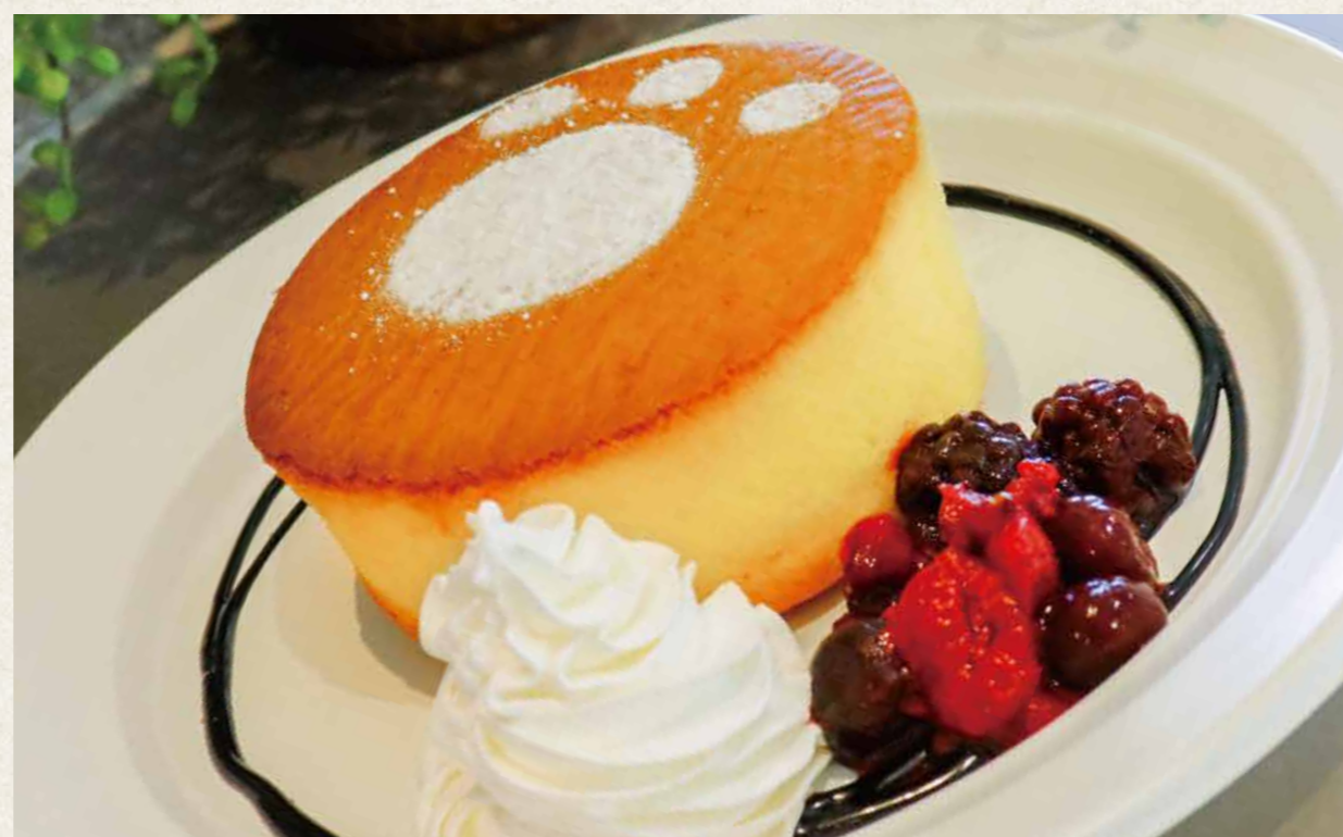
窯焼きホットケーキ ¥540(税込¥594)