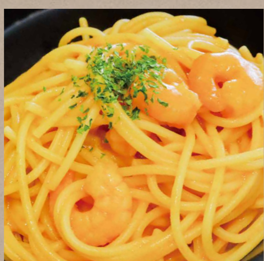
ぷりぷり海老のトマトクリームソースパスタ ¥800(税込¥880)