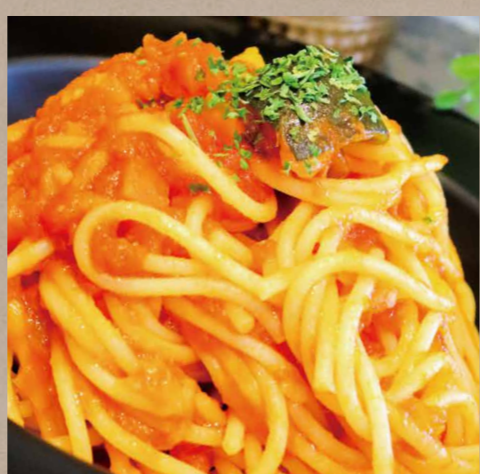
彩野菜のカポナータソースパスタ ¥880(税込¥880)