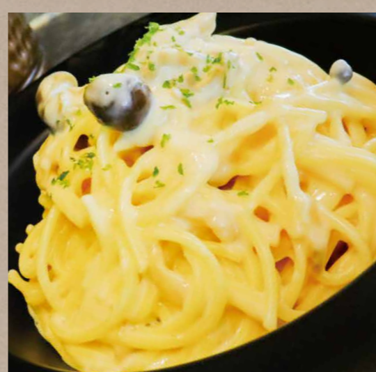
きのこのチーズクリームソースパスタ ¥880(税込¥880)