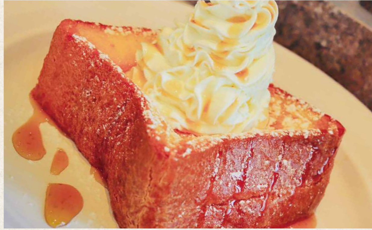
ふわとろ厚切りフレンチトースト ¥630(税込¥693)